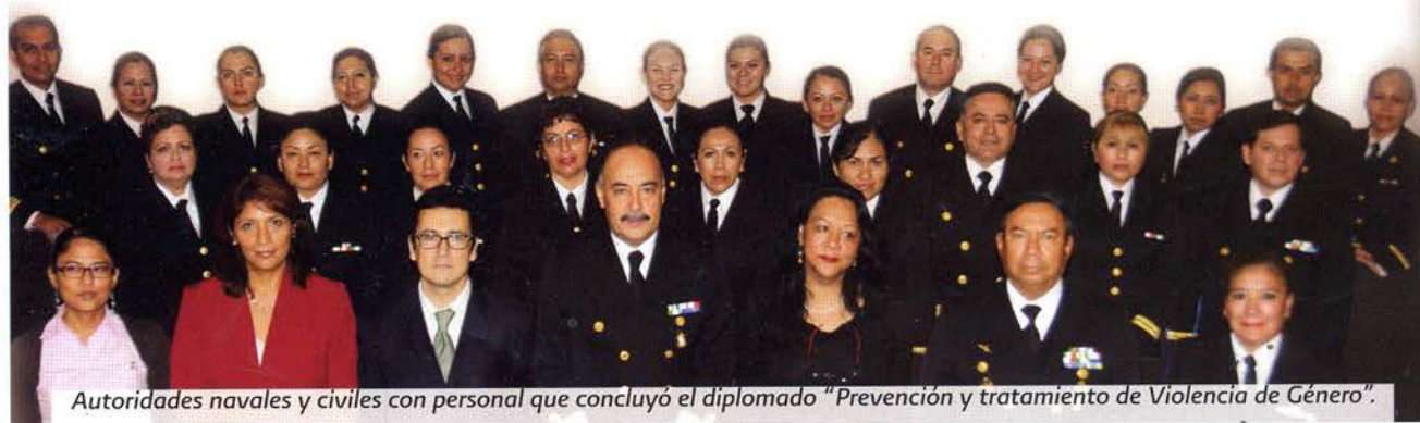
Autoridades navales y civiles con personal que concluyó el diplomado "Prevención y tratamiento de Violencia de Género".

En el módulo Modelaje e intervención en crisis, se instruyó al personal en cómo realizar una contención emocional breve, sensible y con perspectiva de género, y finalmente, en el de práctica para el buen trato, se subrayó que es mejor iniciar las relaciones interpersonales desde un buen trato y no desde la violencia.