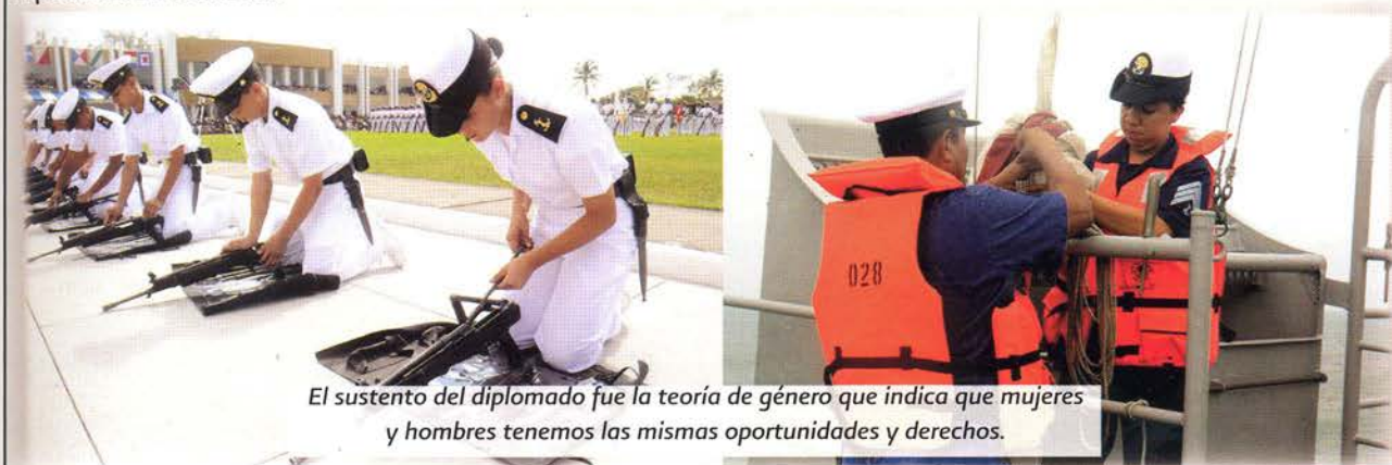
El sustento del diplomado fue la teoría de género que indica que mujeres y hombres tenemos las mismas oportunidades y derechos.

De esta manera, la Secretaría de Marina se une a los objetivos del Estado Mexicano que en esta Administración hará tangibles los compromisos asumidos al ratificar la Convención sobre la Eliminación de todas las Formas de Discriminación contra la Mujer (CEDAW, por sus siglas en inglés), así como lo establecido en los Artículos 2, 9 y 14 de la Ley de Planeación referentes a la incorporación de la perspectiva de género en la planeación nacional.