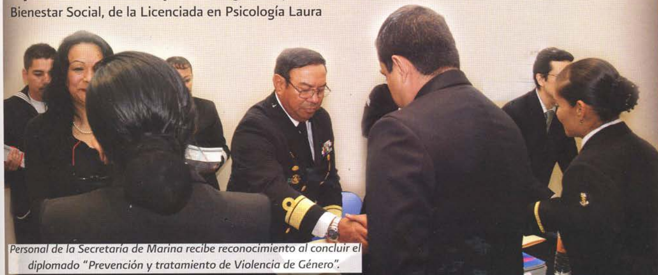
Personal de la Secretaría de Marina recibe reconocimiento al concluir el diplomado “Prevención y tratamiento de Violencia de Género”.