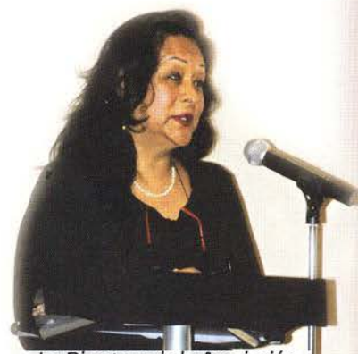
La Directora de la Asociación para el Desarrollo Integral de Personas Violadas, A.C., señaló que la impartición de este diplomado generó un aprendizaje mutuo.